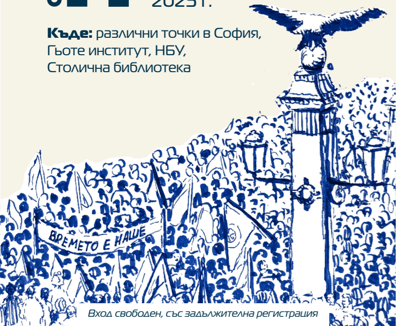
Вход свободен, със задължителна регистрация

Къде: различни точки в София, Гьоте институт, НБУ, Столична библиотека